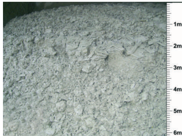
A homokszemcse súlyának a 20 %-a anyag- százalékban kimosott, eltávolított agyagköpeny a kemény kopóréteg- kvarchomokból.

A tisztasági követelmény a Weissenböcktől szed köveket garatál barátságosabb színekkel, hosszú élettartamot és egy zártabb finomságát megőrző felületet.