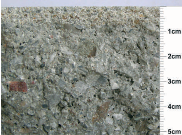
Weissenböck keresztül hasított térkő, min. 5 mm kopóréteggel és alapbetonnal.